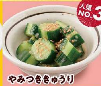
やみつききゅうり