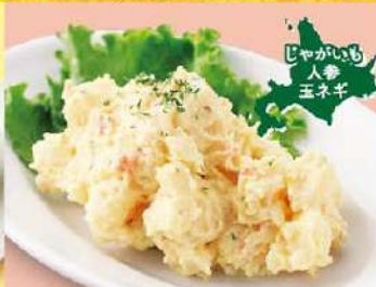
北海道ポテトサラダ