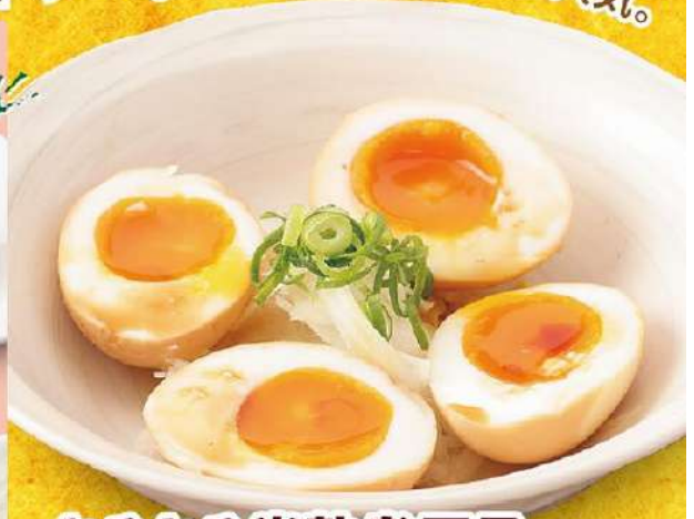
とろとろ半熟煮玉子