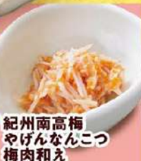
紀州南高梅 やげんなんこつ 梅肉和え