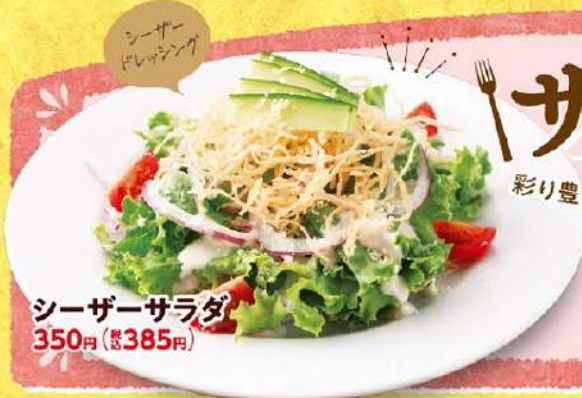
シーザーサラダ 350円(税込385円)