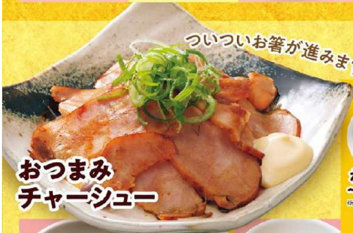
おつまみ チャーシュー