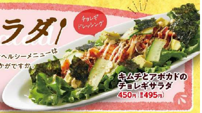
キムチとアボカドの チヨレギサラダ 450円(税込495円)