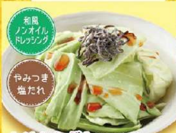
とりあえずキャベツ