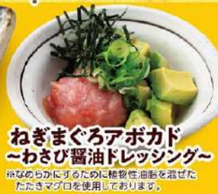
ねぎまぐろアボカド